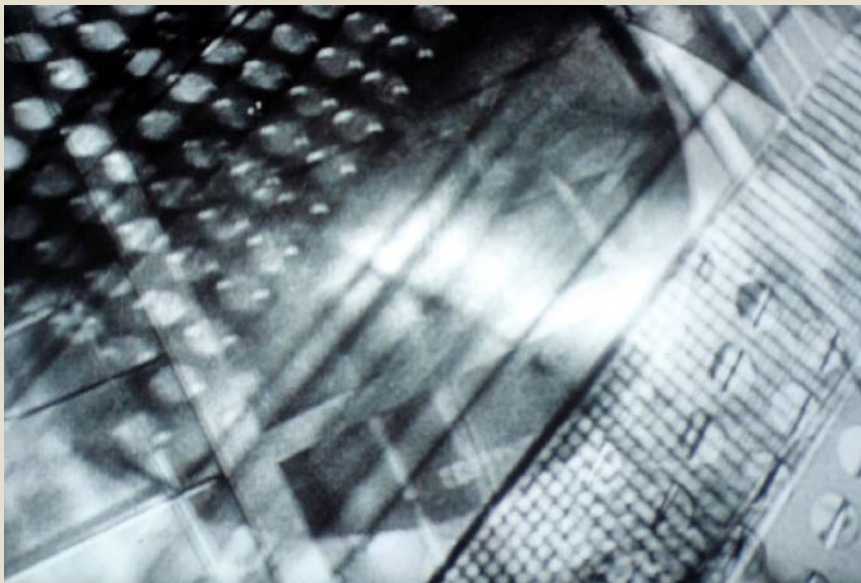
©Modulateur Espace Lumière de Moholy Nagy