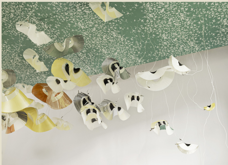
Reef.2, Aurélie Mossé, 2011