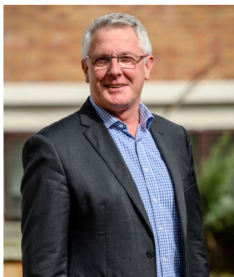
Jean-Christophe Camart Président

sa sphère d'influence au monde entier, comme l'attestent ses collaborations internationales de haut niveau, nouées avec plus de 50 pays. Forte de ses 74 000 étudiantes et étudiants (dont 9 500 internationaux), 7 200 personnels, 62 unités de recherche et une offre de formation qui couvre l'ensemble des champs disciplinaires, l'Université de Lille s'impose comme un acteur majeur de la région pour la formation, la recherche, et l'innovation et par son engagement sur les questions de société.