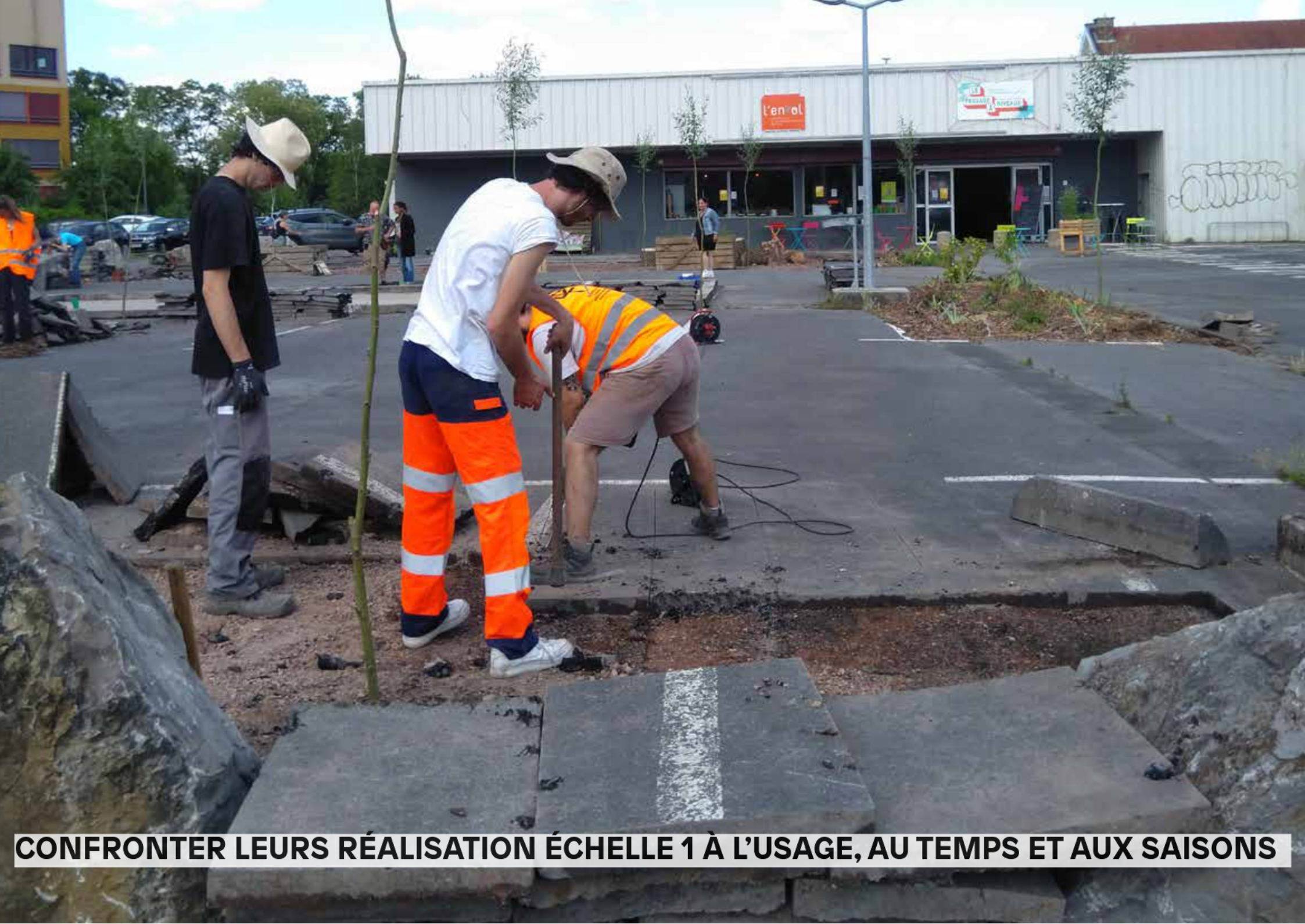
CONFRONTER LEURS RÉALISATION ÉCHELLE 1 À L'USAGE, AU TEMPS ET AUX SAISONS